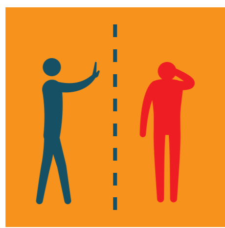
ИЗБЯГВАЙТЕ КОНТАКТ С БОЛНИ ХОРА