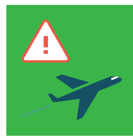
ИЗБЯГВАЙТЕ ПЪТУВАНИЯ ДО ЗАРАЗЕНИ ДЪРЖАВИ И РЕГИОНИ