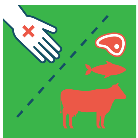
ИЗБЯГВАЙТЕ КОНТАКТ С ЖИВОТНИ И ЖИВОТИНСКИ ПРОДУКТИ