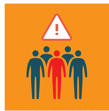
ИЗБЯГВАЙТЕ МАСОВИ СЪБИТИЯ