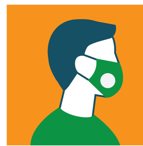
НОСЕТЕ МАСКА С ФИЛТЪР