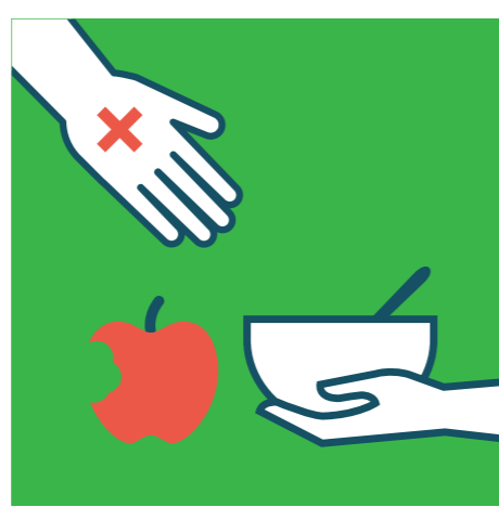
НЕ СПОДЕЛЯЙТЕ ХРАНА И ПОСУДА