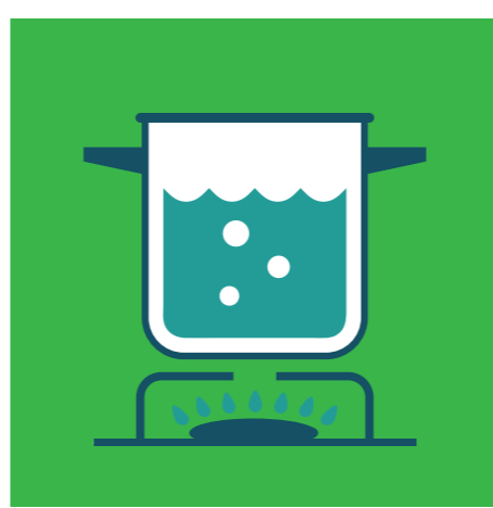
НЕ ЯЖТЕ СУРОВА ХРАНА, ГОТВЕТЕ ДОБРЕ МЕСО И ЯЙЦА