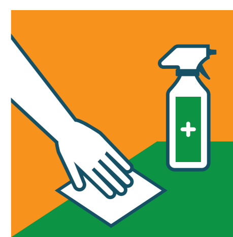
ПОДДЪРЖАЙТЕ ПОВЪРХНОСТИТЕ И ДРЪЖКИТЕ НА ВРАТИТЕ ЧИСТИ