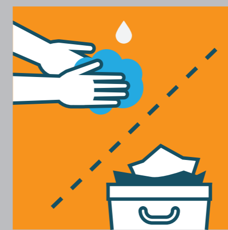
ИЗПОЛЗВАЙТЕ ПОЧИСТВАЩИ КЪРПИ С АЛКОХОЛ