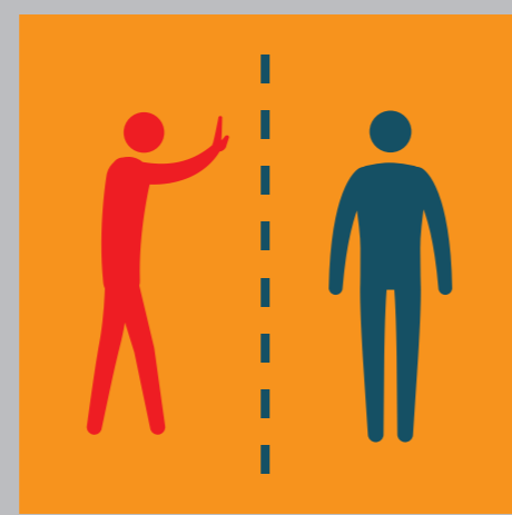
ИЗБЯГВАЙТЕ КОНТАКТ С ДРУГИ