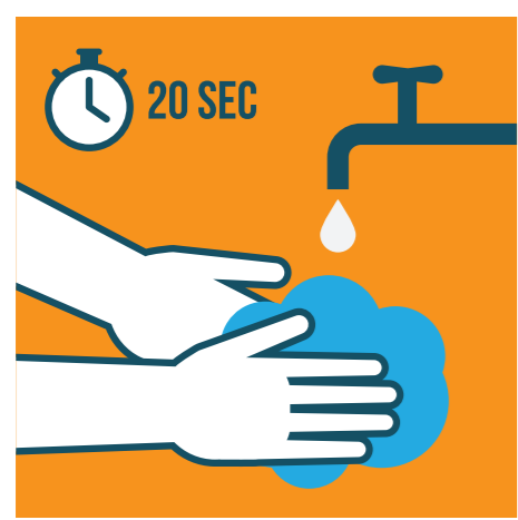
МИЙТЕ РЪЦЕТЕ СИ ЧЕСТО И С ПОЧИСТВАЩ ПРЕПАРАТ